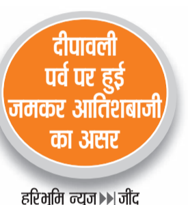
हरिभूमि न्यूज ► जींद