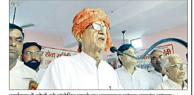
कार्यक्रम में लोगों को संबोधित करते हुए राज्यसभा सांसद रामचंद्र जांगड़ा।

जुलाना। जुलाना के हांसी मार्ग पर स्थित विश्वकर्मा मंदिर में भगवान विश्वकर्मा जयंती बुधवार को बड़ी धूमधाम से मनाई गई। कार्यक्रम की शुरुआत हवन के साथ की गई। हवन में गणमान्य लोगों ने आहुति डाली। मंदिर में भंडारे का भी आयोजन किया गया। जिसमें हजारों की संख्या में लोगों ने प्रसाद ग्रहण किया। कार्यक्रम में मुख्यातिथि के रूप में राज्यसभा सांसद रामचंद्र जांगड़ा ने शिरकत की। कार्यक्रम में लोगों को संबोधित करते हुए राज्यसभा सांसद रामचंद्र जांगड़ा ने कहा कि भगवान विश्वकर्मा का जो विराट स्वरूप है, उसको और ज्यादा विराट करें। हरियाणा में बहुत से हुक्मनर रहे। चौपाल का राज आया तो चौधरी देवीलाल पार्क, देवी लाल यूनियन, देवी लाल स्कूल, देवीलाल चौराहा बनाया। भूपेंद्र सिंह हुड्डा का दांव लगा तो जीद में रणबीर सिंह यूनियन, रोहतक में