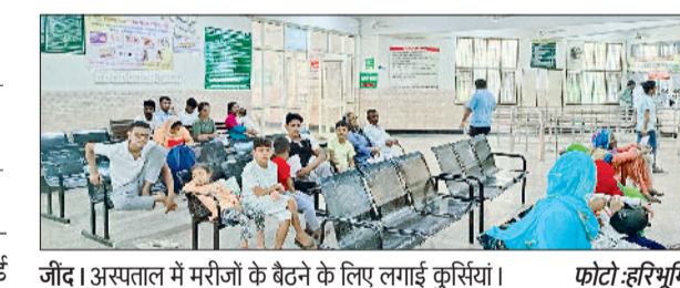
जींद। अस्पताल में मरीजों के बैठने के लिए लगाई कुर्सियां।

नेशनल क्वालिटी एश्योरेंस स्टैंडर्ड (एनक्वैस) की टीम 27 अक्टूबर को जिला मुख्यालय स्थित नागरिक अस्पताल की सुविधाओं का जायजा लेकर मूल्यांकन करने आ रही है। टीम की तैयारियों को लेकर नागरिक अस्पताल प्रबंधन ने अपनी तैयारियां शुरू कर दी हैं। अस्पताल में नजर आ रही कमियों को दूर कर कुर्सियों, बेंच, वेड दुरुस्त किए जा रहे हैं। वहीं टीम के दौरे को लेकर चेक लिस्ट पहले ही नोटल अधिकारियों को