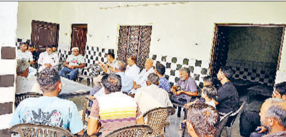
कैथल। ग्रामीणों को जागरूक करती पुलिस टीम।