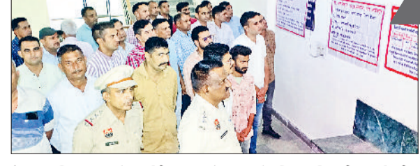
कैथल। पुलिस लाइन में प्रदर्शनी का अवलोकन करते पुलिस अधिकारी व कर्मचारी।

बड़ी संख्या में आमजन ने प्रदर्शनी का अवलोकन किया हरिभूमि न्यूज ► कैथल