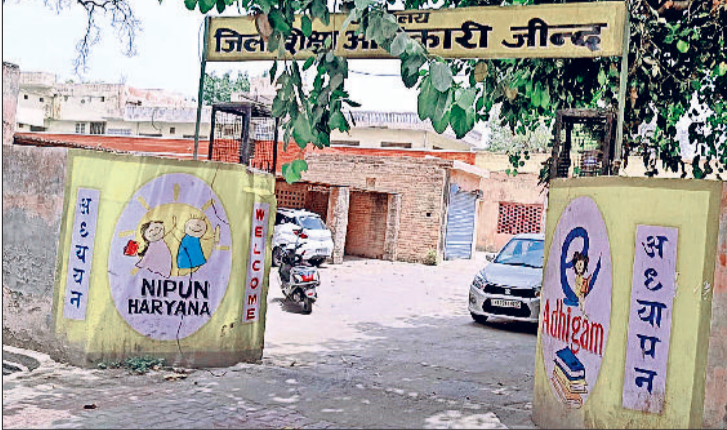
जीद। जिला शिक्षा अधिकारी कार्यालय।

पीएमश्री स्कूलों में पढ़ने वाले प्रदेशभर से 66 विद्यार्थी नवंबर माह में अहमदाबाद स्थित इसरो सेंटर जाएंगे। मेडिकल फिटनेस और अभिभावकों की अनुमति भी जरूरी होगी। इस पहल का उद्देश्य विद्यार्थियों के बीच अंतरिक्ष विज्ञान में अकादमिक उत्कृष्टता और रुचि को प्रेरित और प्रोत्साहित करना है। प्रत्येक जिले से तीन विद्यार्थियों का चयन किया जाएगा। इसमें 10वीं, 11वीं व 12वीं कक्षा से एक-एक विद्यार्थी शामिल रहेंगे। जो अपनी पहली वाली कक्षाओं में टाप पर रहे हों। विद्यार्थी पीएमश्री स्कूल का विद्यार्थी होना चाहिए और उसने अपनी पिछली कक्षा सरकारी स्कूल से पास आउट कर रखी हो। यदि कोई जिला टॉपर पहले ही इसी तरह के अवसर (एडवेंचर कैम्प) का लाभ उठा चुका है तो अगले टॉपर पर विचार किया जाएगा। मेडिकल फिटनेस और