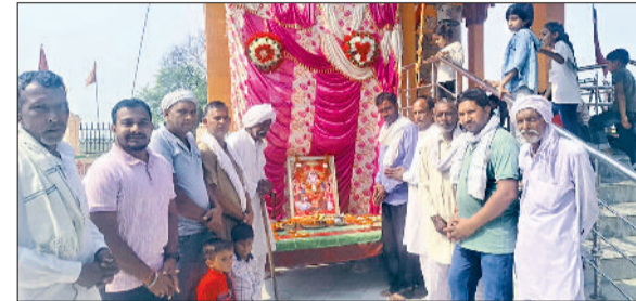
गांव गुलियाणा के हनुमान मंदिर में पूजा कार्यक्रम में भाग लेते हुए समाज के लोग

विकास और आत्मनिर्भरता की दिशा में आगे बढ़ें। उन्होंने कहा कि हमारे पूर्वजों द्वारा लड़े हुए विभिन्न सामाजिक एवं राजनीतिक संघर्षों में भी पिछड़े वर्गों का विशेष सहयोग रहा है। विधायक ने कहा कि केंद्र व राज्य सरकार द्वारा पिछड़े वर्ग के लोगों के सामाजिक, शैक्षिक और आर्थिक उत्थान के लिए अनेक योजनाएं संचालित की जा रही हैं। जिनका उद्देश्य समाज के इस वर्ग को मुख्यधारा से जोड़ना और आत्मनिर्भर बनाना है। हरियाणा पिछड़ा वर्ग वित्त एवं विकास निगम के माध्यम से पात्र लाभार्थियों को स्वरोजगार के लिए रियायती दरों पर ऋण उपलब्ध करवाए जा रहे हैं। इसके अंतर्गत लाभार्थी छोटे व्यवसाय, दुकान, डेयरी, पशुपालन, सिलाई, कढ़ाई, ब्यूटी पार्लर, मोबाइल रिपैरिंग, कंप्यूटर, इलेक्ट्रिशियन आदि कार्य प्रारंभ कर सकते हैं।