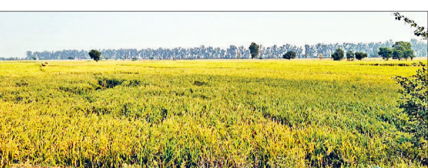
जींद। तापमान बढ़ने से साफ हुआ आसमान।

खेतों में पराली जलाने की घटनाएं सामने आने व दीपावली पर्व पर की गई जमकर आतिशबाजी ने शहर की हवा को जहरीली कर दिया है। हालांकि बुधवार को मौसम साफ रहा और जींद का एक्यूआई 236 पर रहा। जोकि पूंजर श्रेणी में आता है और यह सांस के रोगियों के लिए खतरनाक होता है। बुधवार को अधिकतम तापमान 32 डिग्री तथा न्यूनतम तापमान 17 डिग्री दर्ज किया गया। जबकि प्रति घंटा की गति में आद्रता 51 प्रतिशत बनी रही। मौसम साफ रहा और गुनगुनी धूप निकली। चिकित्सकों ने सांस के रोगियों को भारी भरकम काम न करने की सलाह दी है।