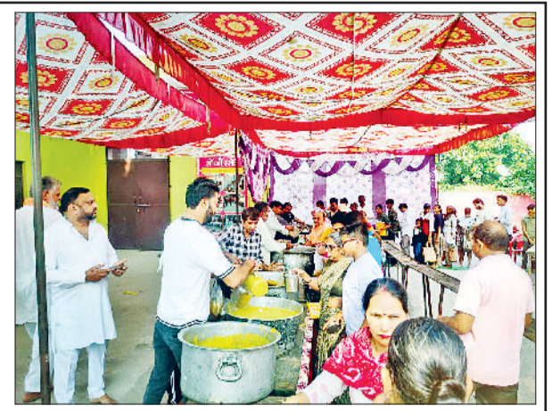
जीद। रानी तालाब पर लगाए भंडारे में प्रसाद लेते हुए श्रद्धालु व भंडारे में प्रसाद ग्रहण करते हुए श्रद्धालु। माता वैष्णवी धाम में प्रसाद लेते हुए श्रद्धालु व जयंती देवी मंदिर में पूजा करते हुए श्रद्धालु व जयंती देवी मंदिर में आयोजित भंडारे में प्रसाद ग्रहण करते हुए श्रद्धालु।